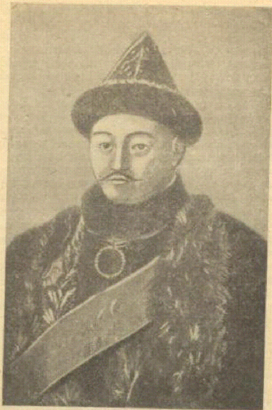
Казакский хан Меньшей Орды Джангир-хан (В качестве хана управлял Бухеевской ордой с 1824 по 1849 год)

ла подобная же группа лиц: хан со своими султанами и родоначальниками-старейшинами, тарханами и датхами. Несмотря на различные формы управления и разные звания этих феодалов, классовое содержание их господства было одно.