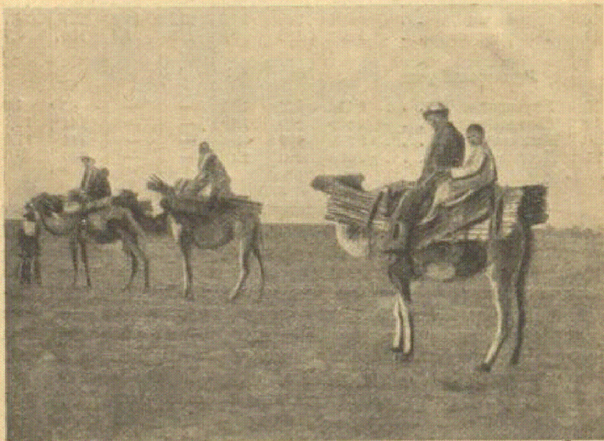
Казахские кочевники, едушие на отхожие промысла

Как известно, основными видами скота в кочевом хозяйстве являлись лошади, овцы и верблюды. Рогатый скот в прошлом у кочевников совершенно отсутствовал; в натуральном кочевом хозяйстве рогатый скот презирался, его считали самым худшим видом скота; это получило даже соответствующее отражение в казахской народной литературе — у казахов имеются характерные поговорки («салдын жаманы—сыер» — худший вид скота — рогатый скот и т. п.). Но с проникновением капитализма в казахский аул, с разложением казахского крестьянства, развитием внутреннего рынка и повышенном товарности скотоводческого хозяйства изменяется экономическая структура казахского аула,