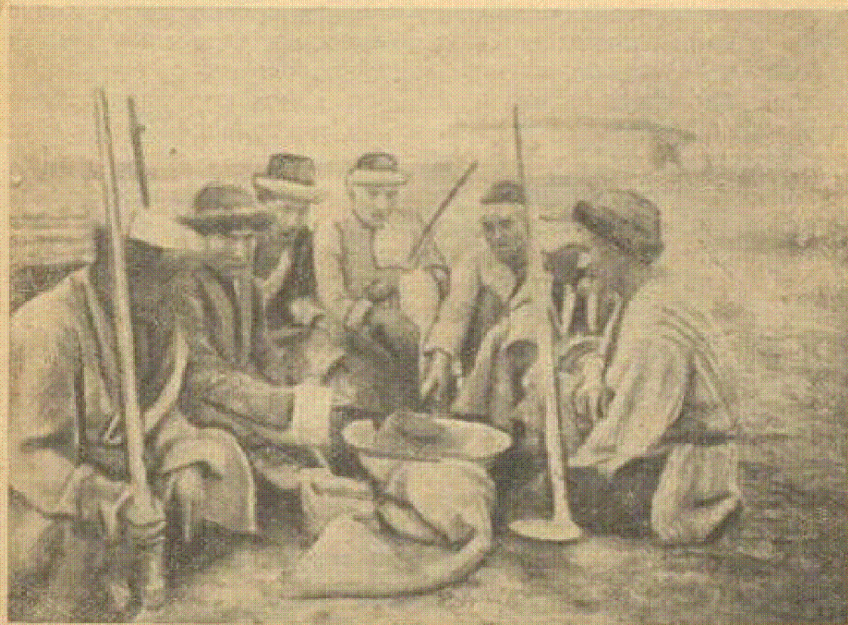
Казак-отходники (мендикеры) Туркестанского уезда Сыр-Дарьинской области

лых отдаленных уездах. Выталкиваемые в ряды сельскохозяйственного пролетариата батрацкие и бедняцкие хозяйства, не встречавшие в ауле достаточного спроса на рабочую силу или стремившиеся «туда, где лучше» (Ленин), искали работы на стороне. Во-вторых, эти же казакские районы, где наиболее сильно было развито отходничество, являлись районами со смешанным казакско-русским населением. В русских деревнях развитие капитализма шло быстрее, чем в казакском ауле, и со стороны русских кулацких и зажиточных хозяйств предъявлялся большой спрос на сезонных рабочих, особенно во время уборки хлеба. По-