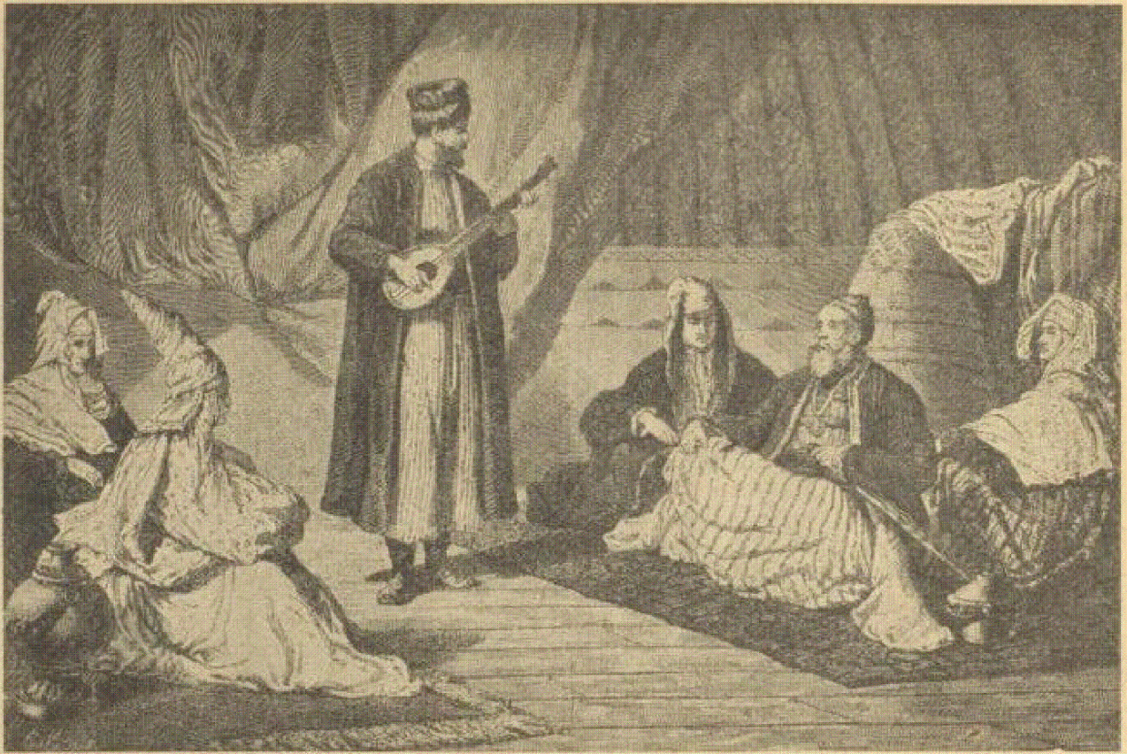
Казакский султан, его жены и певец (в начале XIX века)